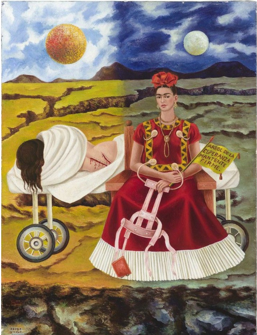
Documento 3 - Árbol de la esperanza mantente firme , Frida Kahlo 1946 (óleo sobre fibra dura 55,9 X 40,6 cm Colección Particular).

En el fondo, vemos un cielo tormentoso que pone en tela de juicio el sufrimiento y el dolor así que deducimos que están fuera. Con este espacio, Frida Kahlo logra anteponer el cielo y la tierra, otra dualidad. Esta obra nos ofrece una reflexión sobre su propia identidad y al mismo tiempo plasma su complicada relación con Diego Rivera.