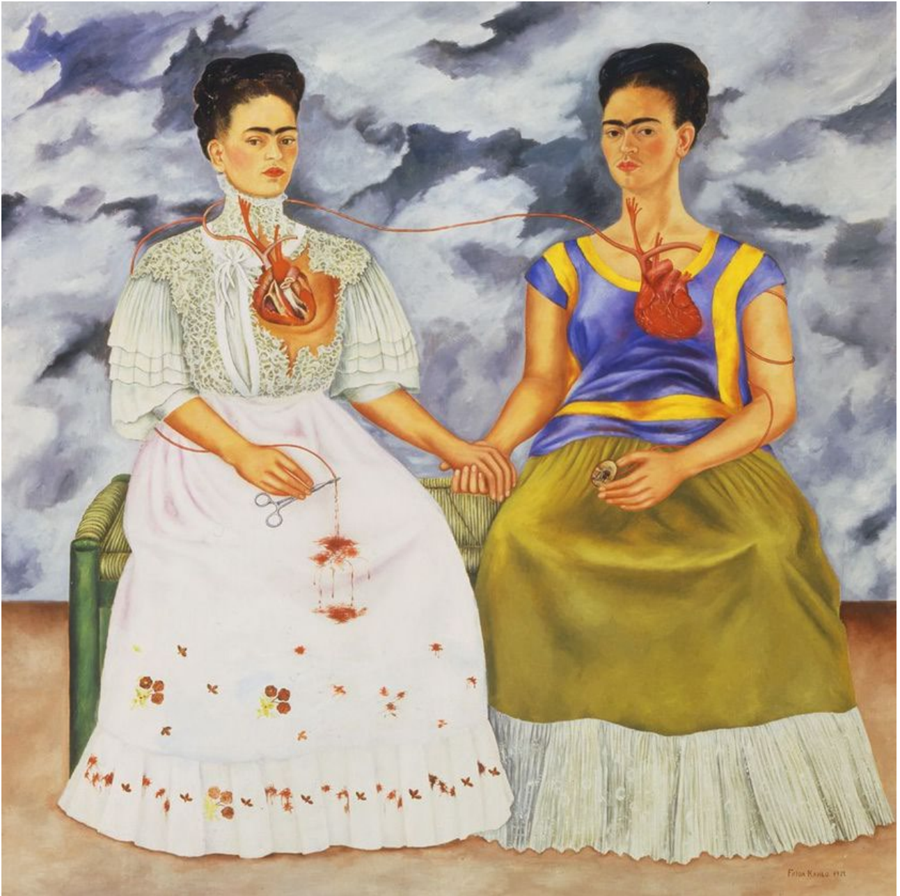
Las dos Fridas , Frida Kahlo 1939 (óleo sobre lienzo 173X173 cm Museo de Arte Moderno en la Ciudad de México, en México).

À titre d'exemple nous allons prendre un tableau d'une célèbre peintre mexicaine que vous connaissez sans doute: Frida Kahlo. Intégrer cette illustre artiste dans propos prend tout son sens. D'abord parce qu'elle figure parmi les femmes sélectionnées par Rosa Montero dans son livre Nosotras dont la couverture nous a permis d'ouvrir le chapitre. Mais aussi parce que son rapport à l'art s'imbrique très nettement dans la dynamique qui se dégage de notre structure.