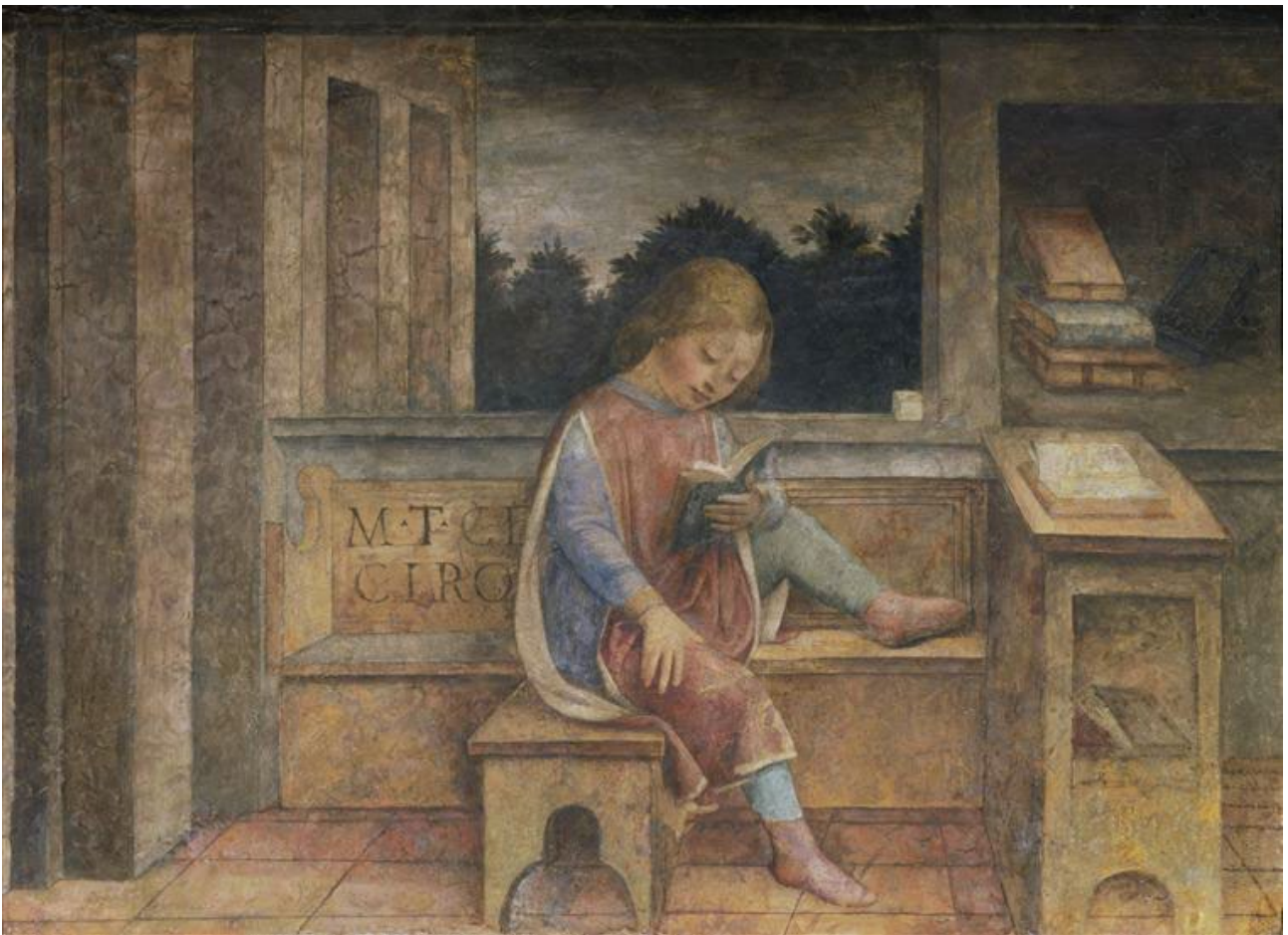
Le Jeune Cicéron à la lecture, 1464, fresque, Foppa Vincenzo à voir à la Wallace Collection à Londres.