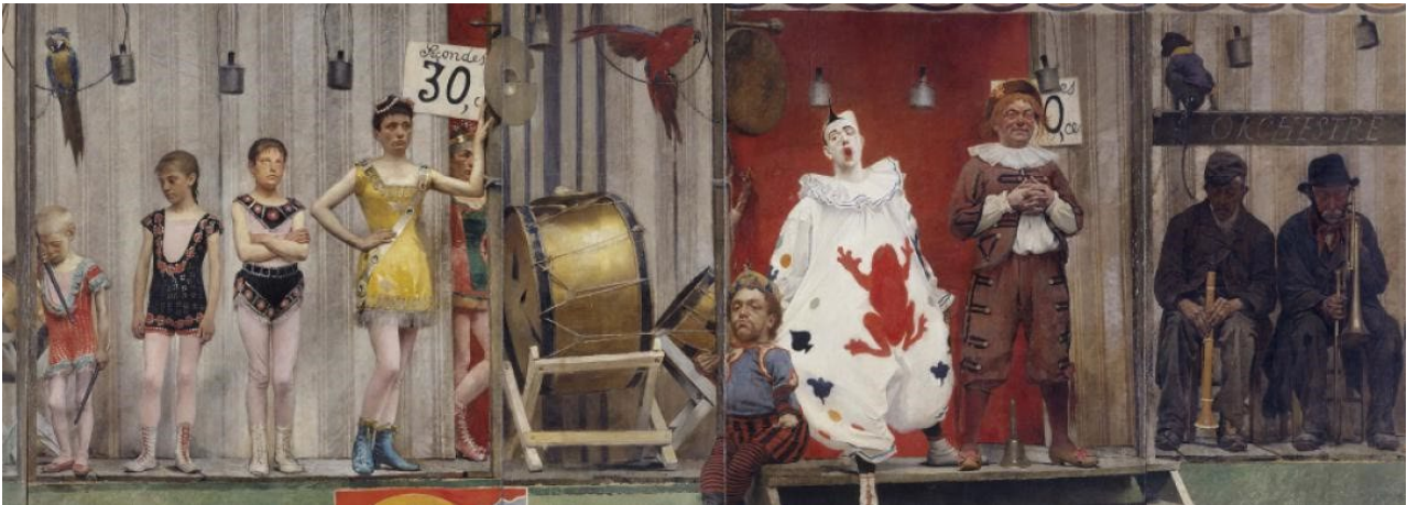
Fernand Pelez - La parade des humbles

Les adultes sont heureux contrairement aux enfants. Les musiciens jouent bien qu'ils soient épuisés.