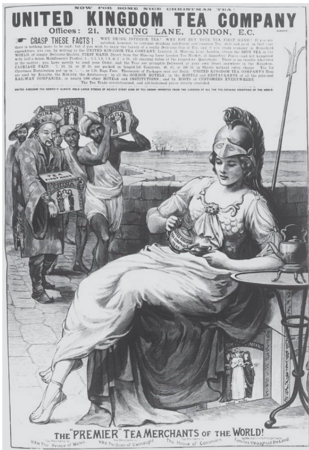
Figure 4 : Advertisement for British Tea Company. May 1895