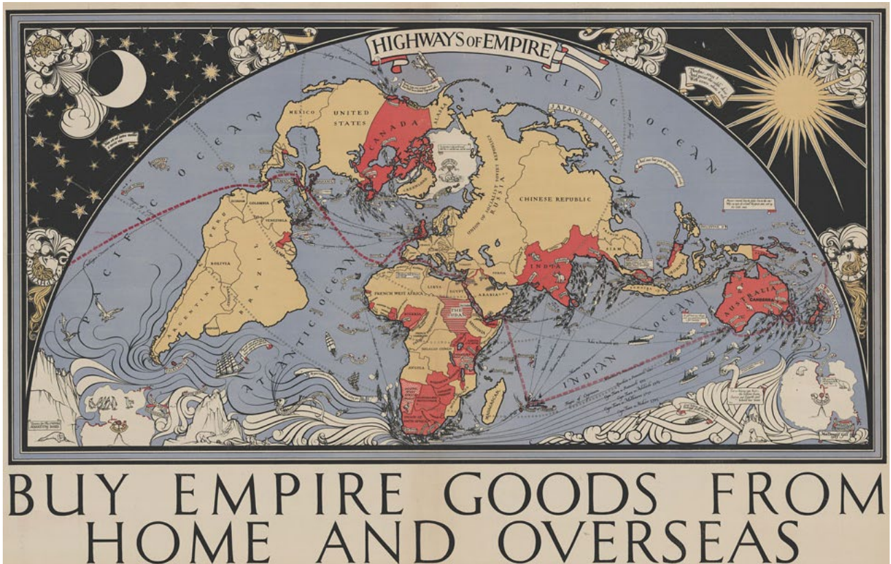
A 1927 pictorial map with all the dominions and trade routes. British Empire Marketing Board.

L'objectif dans ce chapitre est de choisir entre deux images et d'expliquer en anglais pendant 5 minutes maximum laquelle illustre le mieux le thème du chapitre tout en justifiant votre choix.