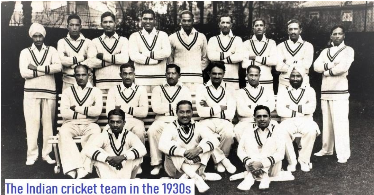
The Indian cricket team in the 1930s