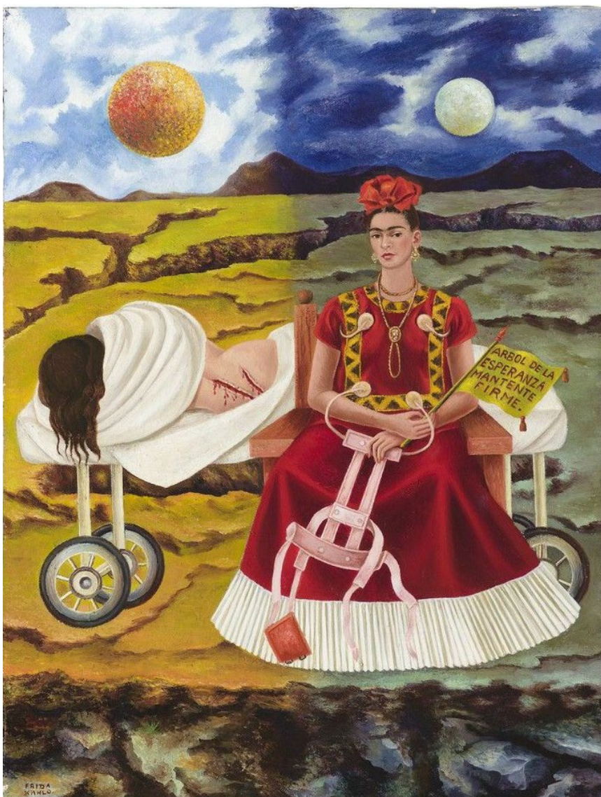
Documento 3 - Árbol de la esperanza mantente firme , Frida Kahlo 1946 (óleo sobre fibra dura 55,9 X 40,6 cm Colección Particular).

En el fondo, vemos un cielo tormentoso que pone en tela de juicio el sufrimiento y el dolor así que deducimos que están fuera. Con este espacio, Frida Kahlo logra anteponer el cielo y la tierra, otra dualidad. Esta obra nos ofrece una reflexión sobre su propia identidad y al mismo tiempo plasma su complicada relación con Diego Rivera.