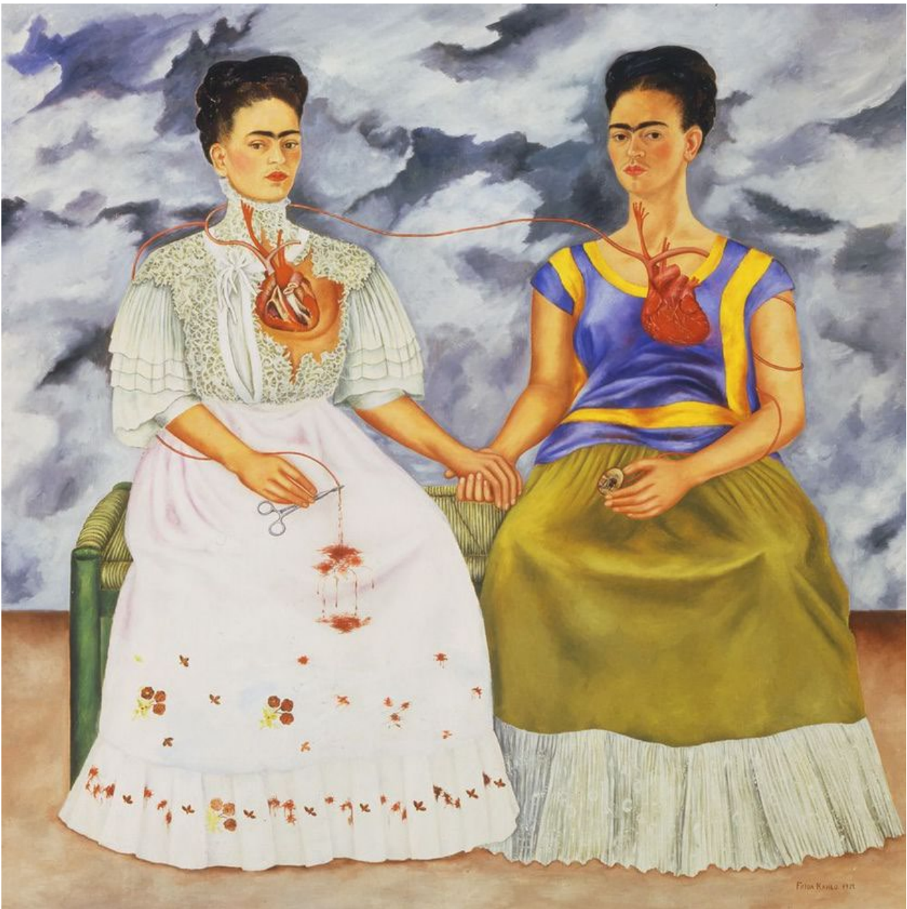
Las dos Fridas , Frida Kahlo 1939 (óleo sobre lienzo 173X173 cm Museo de Arte Moderno en la Ciudad de México, en México).