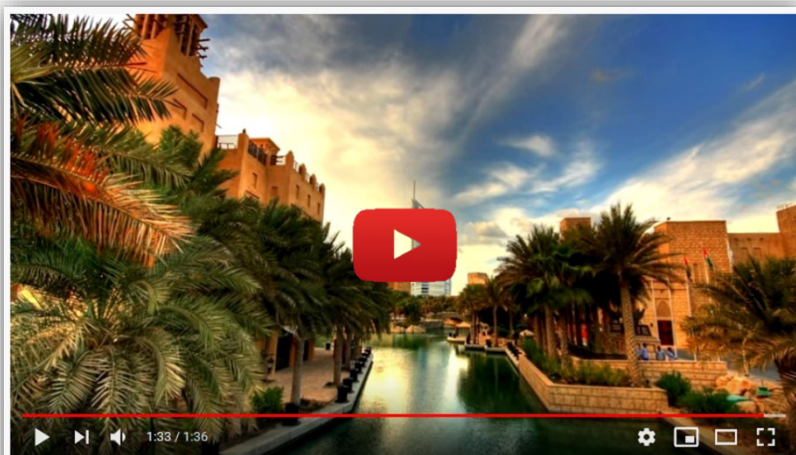
Evolution of Dubai, Satellite imagery, Google Earth (Time lapse)

Au cours de cet exercice, décrivez et commentez l'évolution de la ville de Dubaï entre 1984 et 2016 et faire un petit commentaire de cette évolution. Afin de vous aider, plusieurs mots-clés vous sont donnés afin de vous aider.